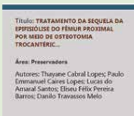
Apresentação de posters