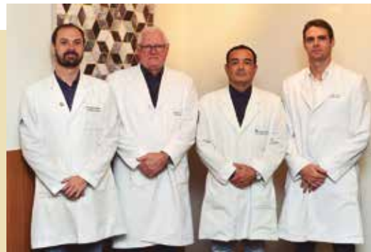
Grupo do Quadril do HO de Passo Fundo