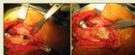
Figuras 2 e 3 – Durante a cirurgia foi realizada a curetagem da lesão femoral que não apresentava aspecto de malignidade, seguida de cimentação, com o objetivo de prevenir fratura dessa área enfraquecida durante o afastamento do fêmur para a revisão acetabular