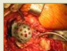
Figura 4 – Revisão acetabular com colocação de enxerto mineral, anel de reforço de titânio (quatro parafusos) e componente cimentado de poliuretano