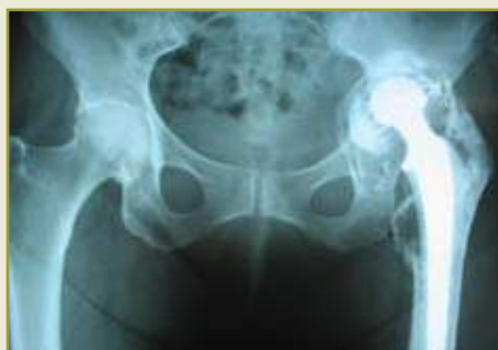
Figura 1 – Radiografia evidenciando soltura do componente acetabular com grave perda óssea. Lesão lítica ao nível do pequeno trocanter com prótese femoral cimentada radiologicamente fixa

Dê sua opinião sobre o caso no fórum do nosso site www.sbquadril.org.br .