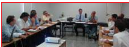
No detalhe, um momento da reunião realizada na sede da SBOT-RJ

produção do livro Patologia do Quadril , além da apresentação, a toda a diretoria, do novo projeto gráfico do site da SBQ e do novo layout do jornal informativo da sociedade.